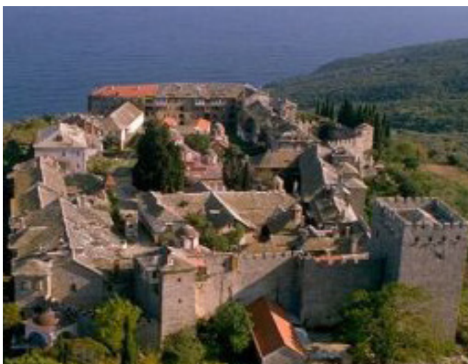
(Лавра св.Афанасия. Афон)

За время пребывания в Глоссии будущий святитель полностью проникся духом исихазма и принял его для себя как основу жизни. В 1326 году из-за угрозы нападения турок вместе с братией он перебрался в Солунь (Фессалоники) , где тогда же был рукоположен в сан священника .