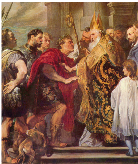
(Ван Дейк "Св. Амвросий Медиоланский и император Феодосий")

Суровое воздержание, долгие бдения и труды Амвросий сочетал с исполнением обязанностей пастыря. Святитель Амвросии отстаивая единство Церкви, энергично противодействовал распространению ересей . Так, в 379 году ему удалось поставить православного епископа в Сирмии, а в 385 - 386 годах он отказался передать арианам базилику Медиолана.