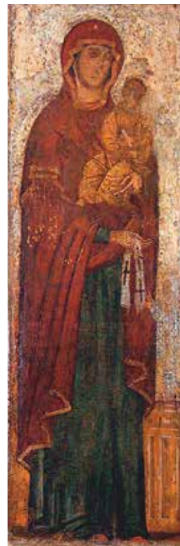
Максимовская икона Божией Матери

Примечательно, что в самом начале своего существования чудотворный образ целых девять лет пребывал при княжьем дворе в церкви Рождества Богородицы в Боголюбове рядом с другой великой чудотворной иконой – Владимирской Божией Матерью. Оба знаменитых образа Пречистой Богородицы стали своего рода палладиумом первых шагов церковной и государственной самостоятельности Северо-Восточной Руси.