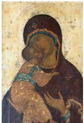
Владимирская икона Божией Матери

По преданию, образ Божией Матери Владимирской был написан евангелистом Лукою на доске от стола, за которым трапезовал Спаситель с Пречистой Матерью. Божия Матерь, увидев этот образ, произнесла: «Отныне ублажат Мя вси роди. Благодарить Рождшегося от Меня и Моя с сим образом да будет».