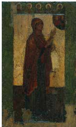
Боголюбская икона Божией Матери

Икону внесли в Успенский собор Московского Кремля. Летопись сообщает, что Тамерлан, простояв на одном месте две недели, внезапно устранился, повернул на юг и вышел из московских пределов. Произошло великое чудо: во время крестного хода с чудотворной иконой, направлявшегося из Владимира в Москву, когда бесчисленное множество народа стояло на коленях по обеим сторонам дороги и молило: «Матерь Божия, спаси землю Русскую!», Тамерлану было видение. Перед его мысленным взором предстала высокая гора, с вершины которой спускались святители с золотыми жезлами, а над ними в лучезарном сиянии явилась Величавая Жена. Она повелела ему оставить пределы России. Проснувшись в трепете, Тамерлан спросил о значении видения. Ему ответили, что сияющая Жена есть Матерь Божия, великая Защитница христиан.