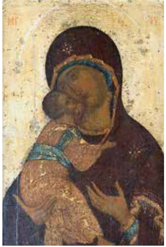
Владимирская икона Божией Матери

По преданию, образ Божией Матери Владимирской был написан евангелистом Лукою на доске от стола, за которым трапезовал Спаситель с Пречистой Матерью. Божия Матерь, увидев этот образ, произнесла: «Отныне ублажат Мя вси роди. Благодарить Рождшегося от Меня и Моя с сим образом да будет».