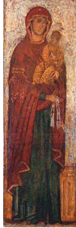
Максимовская икона Божией Матери

Примечательно, что в самом начале своего существования чудотворный образ целых девять лет пребывал при княжьем дворе в церкви Рождества Богородицы в Боголюбове рядом с другой великой чудотворной иконой – Владимирской Божией Матерью. Оба знаменитых образа Пречистой Богородицы стали своего рода палладиумом первых шагов церковной и государственной самостоятельности Северо-Восточной Руси.